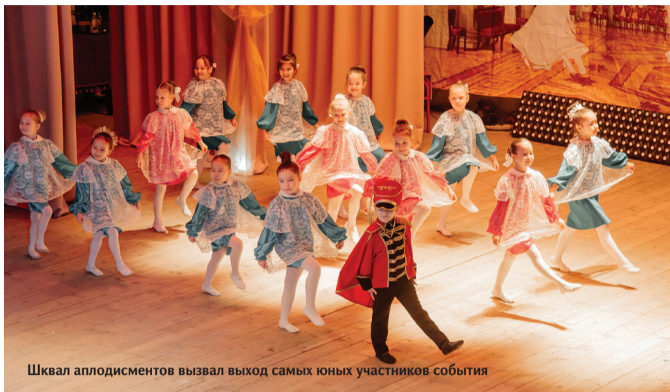
Шквал аплодисментов вызвал выход самых юных участников события

За кулисами мальчишки от мала до велика (а самому юному участнику было 5 лет) подарили своим спутницам по розе. Символичный знак признательности и восхищения красотой. Так что на