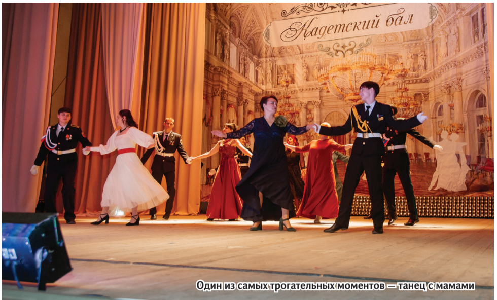
Один из самых трогательных моментов – танец с мамами

126 танцев за эти годы разучили кадеты и их дамы.