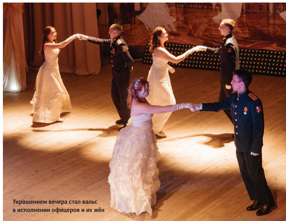
Украшением вечера стал вальс в исполнении офицеров и их жён