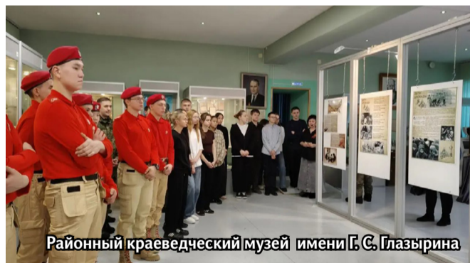
Районный краеведческий музей имени Г.С. Глазырина

Венец мастерства. Профессионал из Билибино вошла в тройку лучших в России