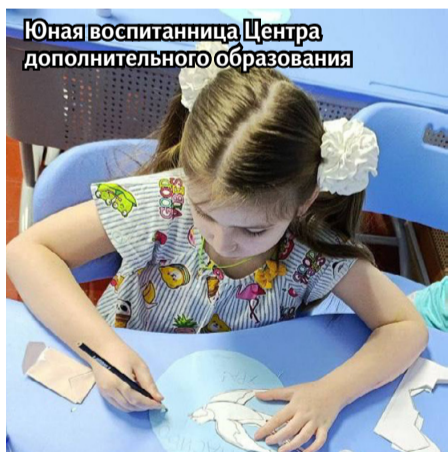
Юная воспитанница Центра дополнительного образования

ки благодарности, выведенные детской рукой. Пока мы вместе об этом помним и говорим – героический Ленинград продолжает жить в наших сердцах.