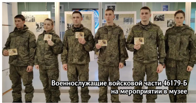
Военнослужащие войсковой части 46179-Б на мероприятии в музее

Традиционно активное участие приняли образовательные учреждения. В средней школе прошла своя акция «Блокадный хлеб» и трогательная «Свеча памя-