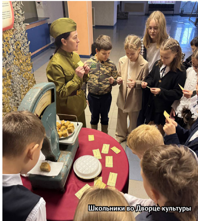
Школьники во Дворце культуры

В конце января, в дни, когда вся страна вспоминает о полном снятии блокады Ленинграда, в нашем городе прошла целая серия памятных мероприятий. От дошколят до военнослужащих – жители всех возрастов включились в акции, чтобы отдать дань уважения мужеству и стойкости ленинградцев.