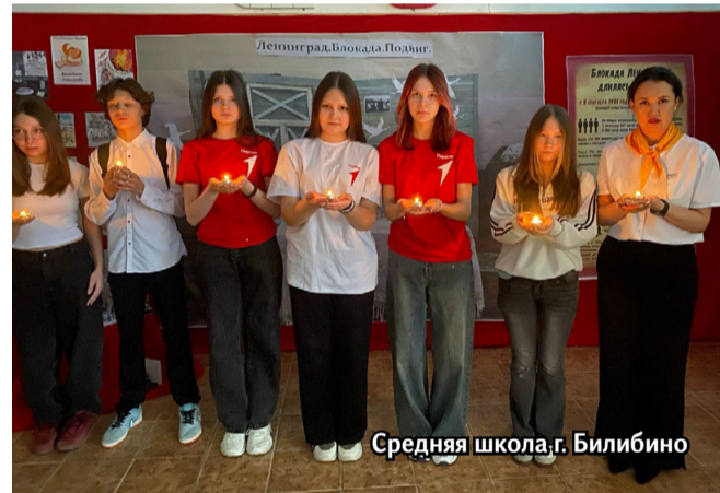
Средняя школа, г. Билибино

Эти дни вновь доказали, что память о великом подвиге – не просто строчки в учебнике. Это живое чувство, которое передается через бумажную ласточку, через кусочек хлеба, через огонек свечи и через стро-