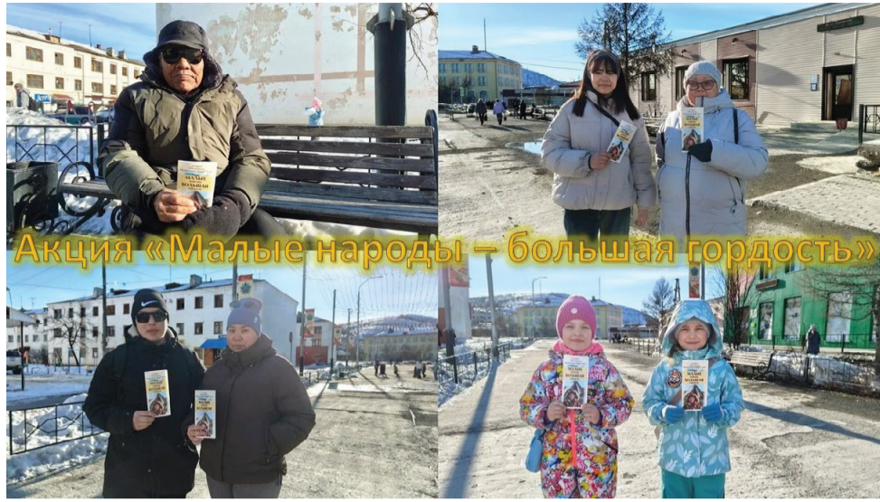
В рамках акции «Малые народы – большая гордость» сотрудники музея познакомили горожан с интересными фактами новой значимой даты – Дне коренных малочисленных народов России, а также рассказали о некоторых этносах нашей страны.

Ребята и ростовые фигуры слушали внимательно: тема явно задела за живое. А после теории наступил черёд практики. Интерактивная викторина «Поедем, погостим!» расшевелила даже самых молчаливых. И, если военнослужащие предпочитали отмалчиваться, то студенты наперебой отвечали на вопросы о географии расселения народов, их кухне и обычаях. В этот день юноши и девушки не только продемонстрировали отличные знания об этнокультурном наследии России, но и узнали много нового. Победитель получил сувенир косторезного искусства и заслуженные аплодисменты.