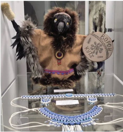
На выставке «Традиции Севера» (0+) представлены экспонаты, сотворённые местными умельцами. В них уникальность и самобытность нашего края.