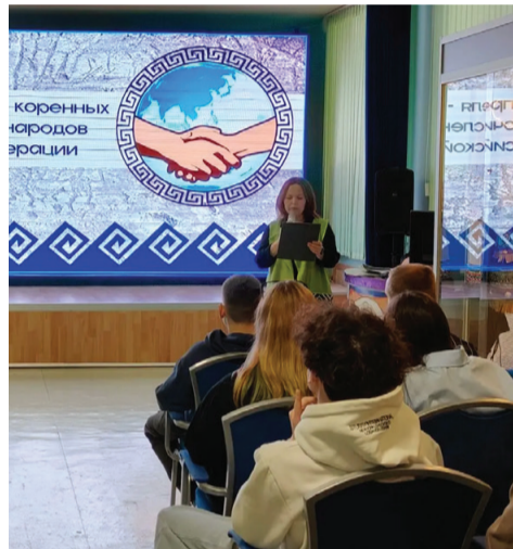
Для студентов Чукотского северо-западного техникума и военнослужащих войсковой части 3537 провели культурно-просветительское мероприятие «Национальное созвучие».